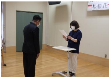
施設長から辞令交付