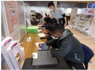
市役所で住民登録