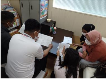
健康診断問診票確認