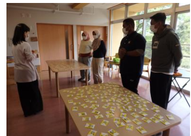
語彙カードで漢字の理解