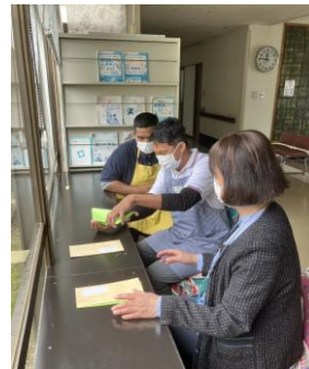
施設長から給与の説明