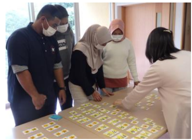
ゲームは楽しい♡ されど、日本語難しい😞