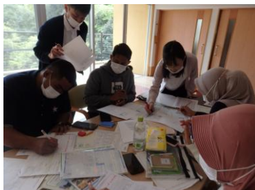
日本語で書く練習