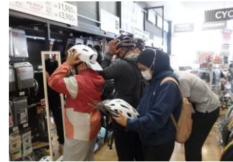
買い物(ヘルメット)