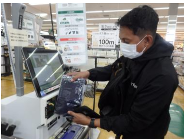
買い物(自転車用カッパ)