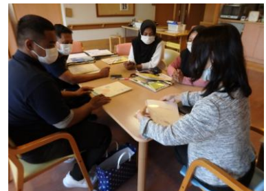
『愛正会人材開発センター』ですが、教材も手作りです