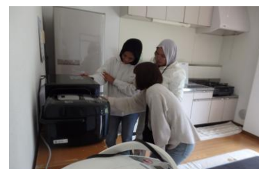
寮にて電化製品取り扱い説明