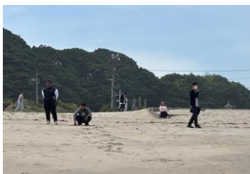
伊師浜海岸で休憩

K センター長 手作りの弁当に舌鼓「日本の稲荷寿司、はじめてです。おいしいです。」