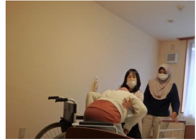
2名の理学療法士から身体の使い方を直伝