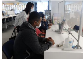
ゴミ収集所利用手続き