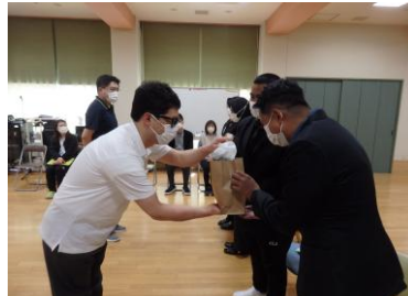
配属ユニットリーダーからお米のプレゼント 支援責任者から記録グッズのプレゼント