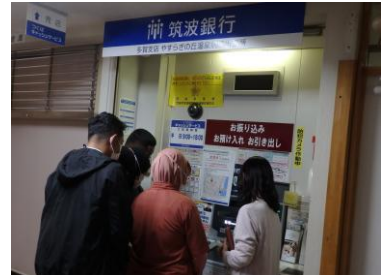
病院の ATM で入金・引き落としの練習