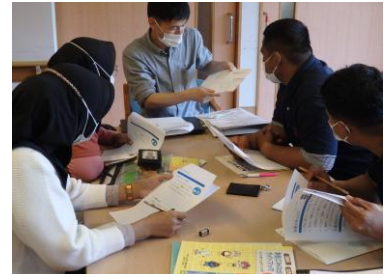
生活する上での決まりごとの説明