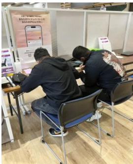
市役所にて申請書に記入